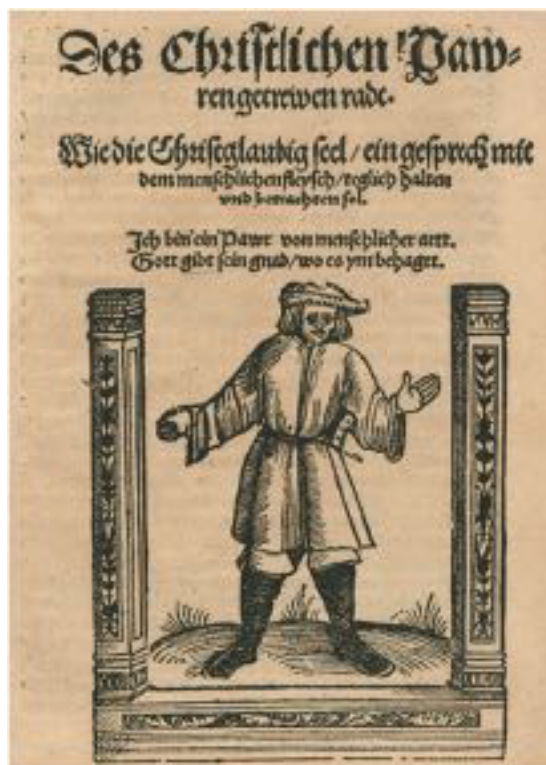
Abb. 3. Holzschnitt, Flugblattumschlag, Diepold Peringer, Des Christlichen Pawren getrewen radt , Schoönsperger, Johann d. J. 1524.

VD 16 P 1389] Staatsbibliothek zu Berlin - Preußischer Kulturbesitz, Abteilung Historische Drucke, Signatur: Cu 5140 : R.