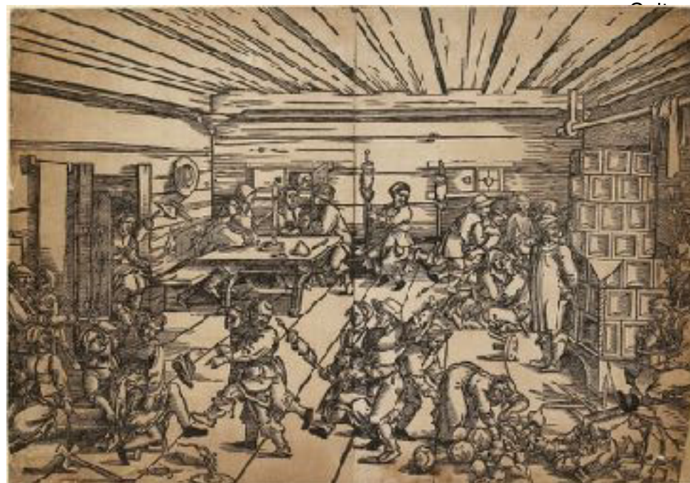
VC Ashmolean Museum, Universität von Oxford.

Dieses Argument war nicht neu: Frühere Bauernrevolten hatten Christi auch der Forderung nach Freiheit zu opfern. 32 Brisant wurde es jedoch, als die Reformation das Abendmahl in beiden Formen einführte. Sie schürte ein Gefühl des gerechten Zorns, weil, so schien es, der Klerus den Laien jahrhundertlang absichtlich den Wein vorenthalten hatte. Dies ging weit über die Missbräuche im Zusammenhang